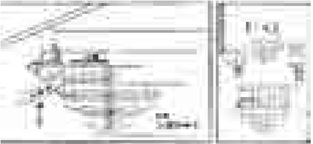
Abb. 1 Ansicht und Detail eines Konsolensystems (teilweise gedreht)