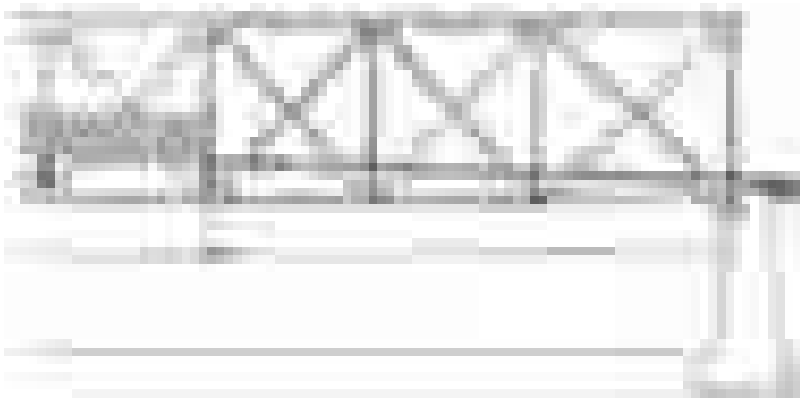
Abb. 1 Berlin Moabit, Querschnitt Straßenbrücke. Verwendung gewölbter, vorgefertigter, zwischen Eisenträgern gespannter Eisenbetonelemente als Unterbau

Auf Grundlage des Monier-Patents hatte Gustav Adolf Wayss (1851–1917) die Bauweise in Zusammenarbeit mit Matthias Koenen (1849–1924) zum ›System Monier‹ weiterent-