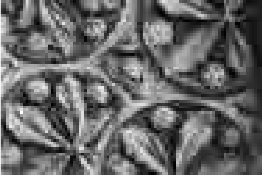
Abb. 7 Detailaufnahme der keramischen Verkleidung

den einzelnen Fliesen nur punktuell erfolgt. Diese Anordnung lässt viel Spielraum für Ungenauigkeiten und erzeugt dennoch ein homogenes Gesamtbild. Die Fähigkeit dieses Musters, Bautoleranzen aufzunehmen, erlaubt es, die zeitaufwendige Vorsortierung der Fliesen zu überspringen. 48 Dies brachte eine wesentliche Vereinfachung der Arbeitsabläufe mit sich, die auch als Sparmaßnahme zu verstehen ist. Die Robustheit und Anpassungsfähigkeit des Musters zeigt sich darin, dass es für schwierig erreichbare Bauteile, wie zum Beispiel die abgerundete Unterseite der Balkone, unverändert verwendet werden konnte.