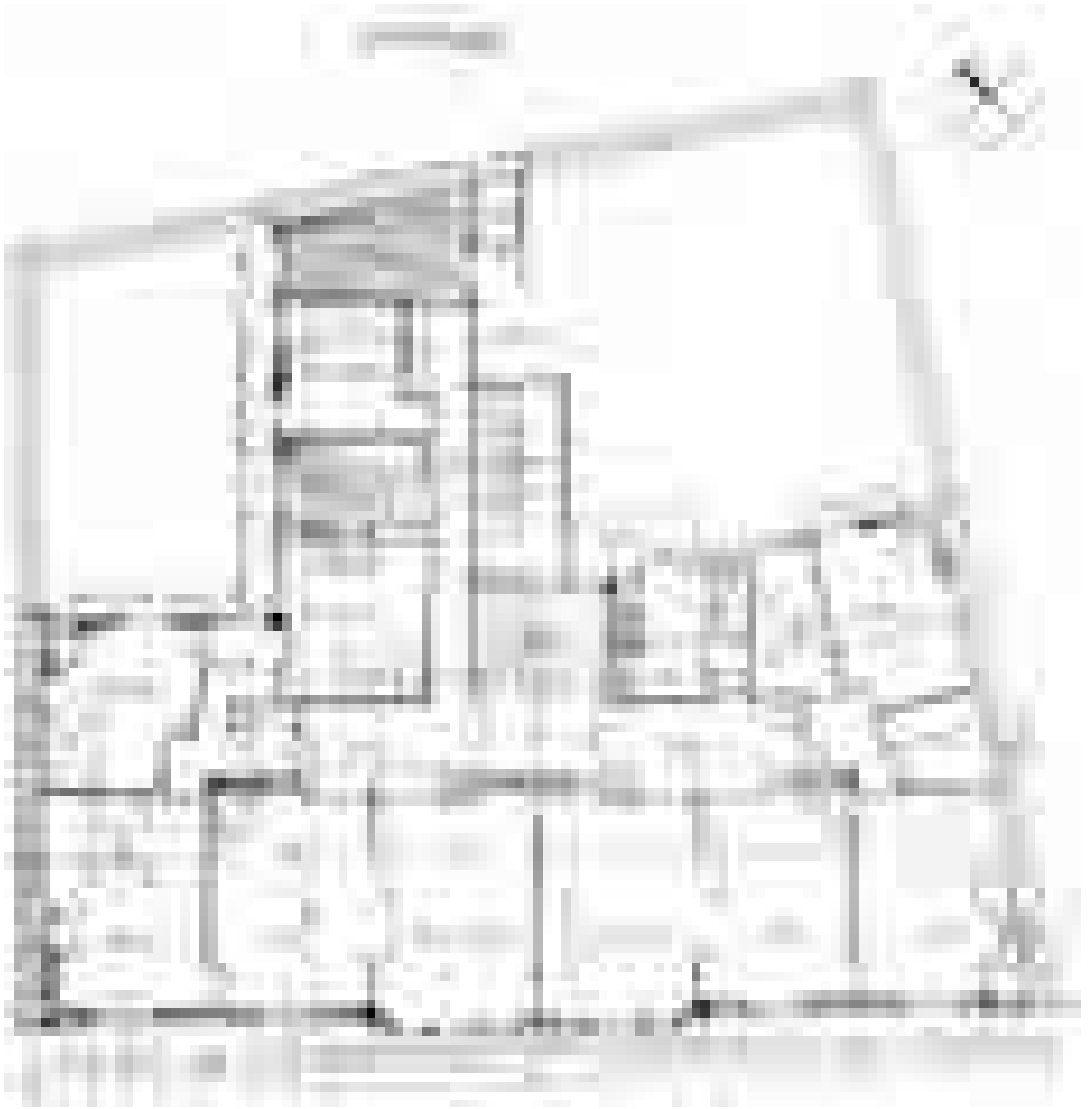
Abb. 2 Wohnhaus 15 Avenue Perrichont, Paris, Grundriss 4. OG 1/50 Joachim Richard, 1907

mer beider Wohnungen wurden im Bereich des leicht auskragenden Erkers angeordnet. Neben der U-förmigen Haupttreppe war eine separate Diensttreppe für Hausangestellte vorgesehen, welche die Küchen der Wohnungen über Balkone erschloss.