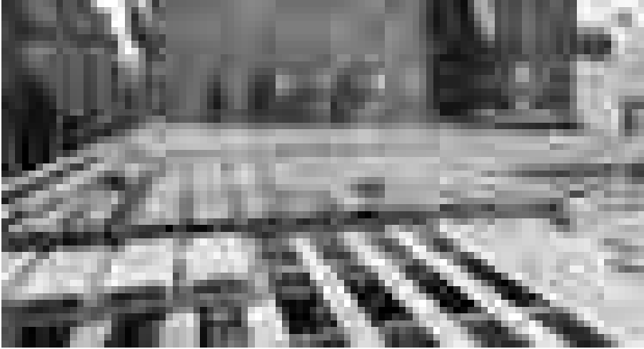
Abb. 4 Wohnhaus 15 Avenue Perrichont, Paris, Baustellenaufnahme anonym, 1907

einem zweiten Schritt wurden die Gipshohlkörper aneinandergereiht und die Eisenarmierung angebracht. Das Betonieren der Decke erfolgte in zwei Etappen: Zuerst wurden die trapezförmigen Zwischenräume ausgefüllt, dann wurde die obere Schicht der Decke gegossen. Der Vorteil dieser Verbunddeckenkonstruktion lag in dem niedrigen Eigengewicht und den geringen Kosten für die Holzschalung, welche sich lediglich aus einzelnen kurzen Holzbrettern zusammensetzte. Sie ermöglichte zudem eine kurze Bauzeit von lediglich zehn Tagen pro Geschoss. 24