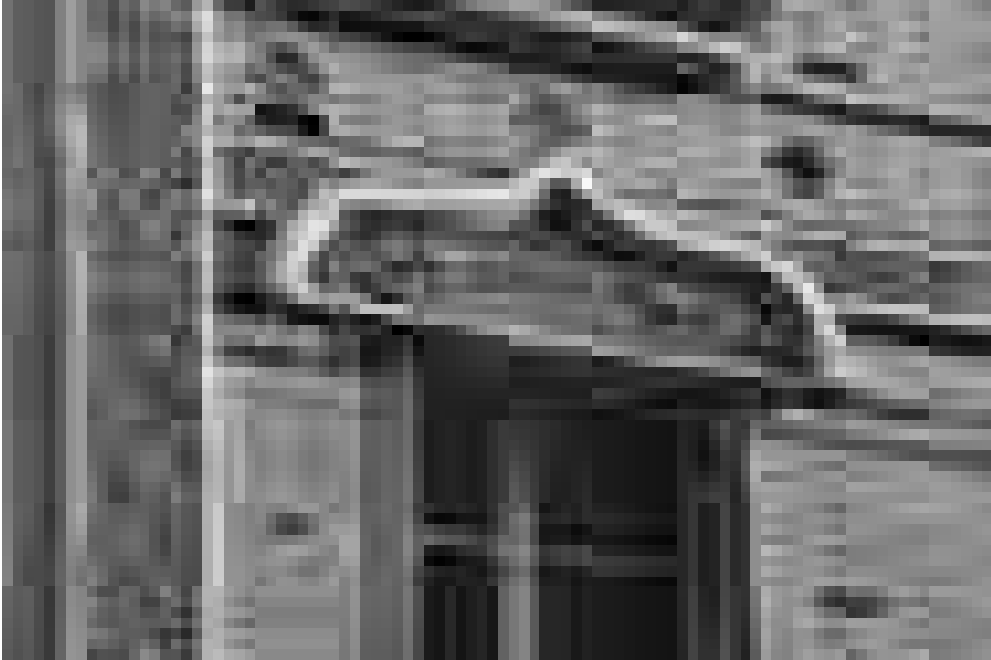
Abb. 5 Detailaufnahme der Backsteinausfachung

Das Ausfachen eines schlanken Tragwerks mit kleinteiligem Baumaterial stellt in der Baugeschichte eine altbekannte Aufgabe dar. Für die Fassade in der Avenue Perrichont wurden die Anschlüsse zwischen der Ziegelmauer und den Betonpfeilern mithilfe von \frac{3}{4} -Steinen gelöst. Ähnliche Sondersteine wurden auch für die Ausbildung der Fensterlaibungen verwendet. Gestalterisch wird der Übergang vom Tragwerk zur Backsteinwand, also vom ›Rahmen‹ zum ›Gefach‹, mittels vorgefertigter Abdeckleisten bewerkstelligt. Diese verdecken die vertikale Fuge zwischen dem Backsteinmauerwerk und dem Betonpfeiler, sodass an dieser Stelle Ungenauigkeiten in der Bauausführung kaschiert werden konnten (Abb. 6). Der horizontale Anschluss zwischen der obersten Backsteinlage und dem darüberliegenden Unterzug ist ähnlich ausgebildet, indem die letzte Lagerfuge mit einer horizontalen Leiste abgedeckt wurde. An den Stirnseiten der Pfeiler und der Unterzüge bilden die beiden parallelen Randleisten ein circa 5 Zentimeter tiefes Feld, welches später mit Mörtel für die Verlegung der keramischen Fliesen ausgefüllt wurde. Mit ihrer weißen Farbgebung betonen die Leisten zudem den Umriss des Tragwerks.