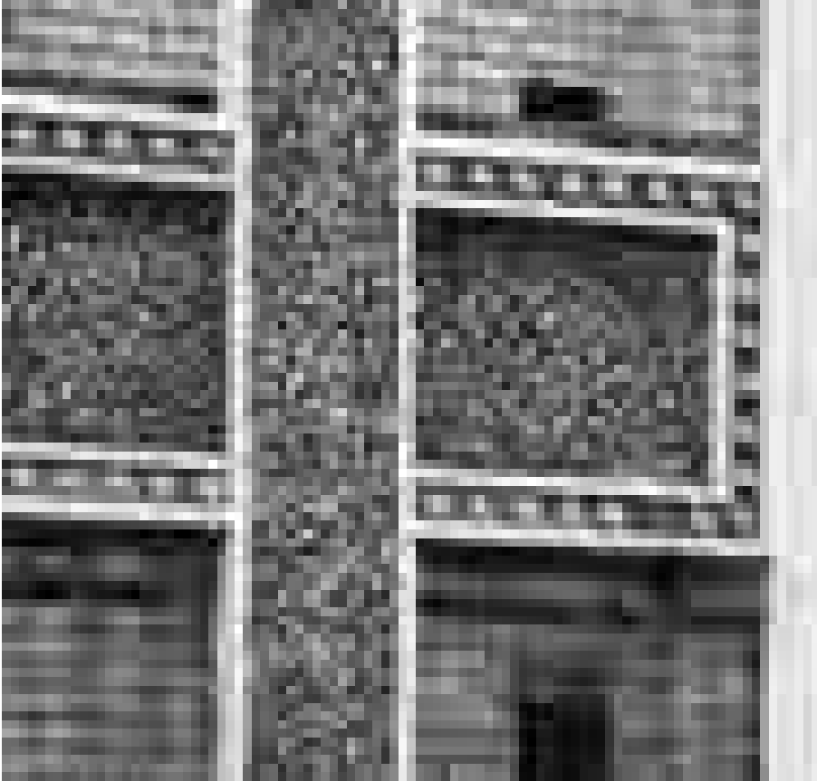
Abb. 6 Detailaufnahme der Abdeckleisten

blätterungen) bezeichnete Befunde sind nicht auf einen Fehlbrand zurückzuführen, sondern in den meisten Fällen das Ergebnis einer mangelnden Abstimmung zwischen Glasur und Teig. 34