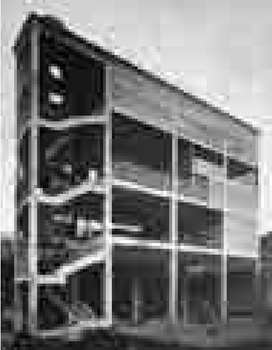
Abb. 8 Textilfärberei Mars, Paris, Architekten Audiger und Richard, 1906