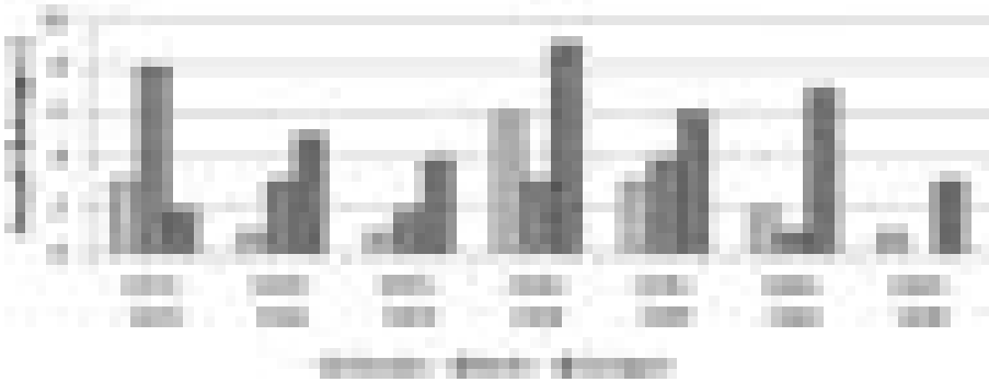
Abb. 4 Anzahl veröffentlichter wissenschaftlicher Beiträge der Material- und Prüfungsämter in der Schriftenreihe des DAfEb/DAfStb von 1910 bis 1949 (man beachte die Zugehörigkeit Dresdens zur Sowjetischen Besatzungszone nach Ende des Zweiten Weltkrieges)