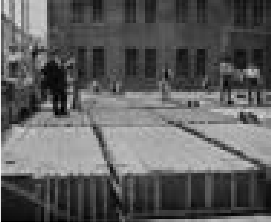
Abb. 2 Druckereigebäude C. G. Röder, Leipzig Perthesstraße 3, Herstellung der Decke über dem ersten Obergeschoss, August 1898