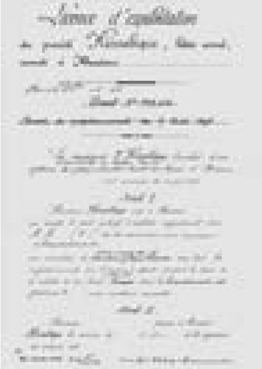
Abb. 7 Entwurf eines Lizenzvertrages vom Juli 1900 mit François Hennebique für Pfähle und Spundwände, 1. Seite; als Grundlage diente der Lizenzvertrag für das grundsätzliche Patent Nr. 223.546 vom 7. August 1895