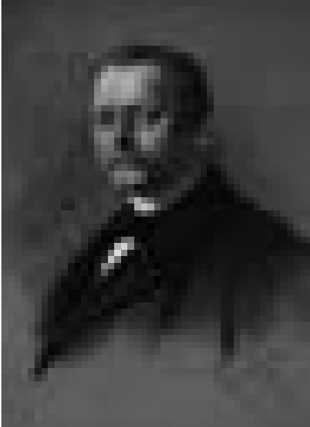
Abb. 1 Portrait Emil Max Pommer (1847–1915), Anton Klamroth 1901

während der er offensichtlich noch nicht gelesene Exemplare der Deutschen Bauwerkszeitung , dem führenden Organ des deutschen Baugewerbes, aufgearbeitet und einen Bericht über das Système Hennebique gelesen hatte, unterbreitete er seinem Bauherrn den Vorschlag, »das neue Druckereigebäude in armierten Beton auszuführen«. 4 Sein Auftraggeber stimmte offensichtlich zu, denn die entsprechende Baugenehmigung des Leipziger Baupolizeiamtes wurde am 7. Mai 1898 erteilt. 5