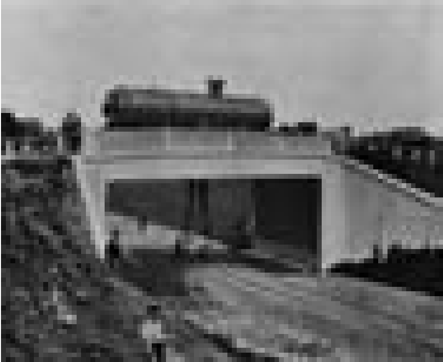
Abb. 6 Brücke über die Chemnitztalbahn bei Markersdorf/Sachsen, Belastungsprobe am 30. Mai 1901