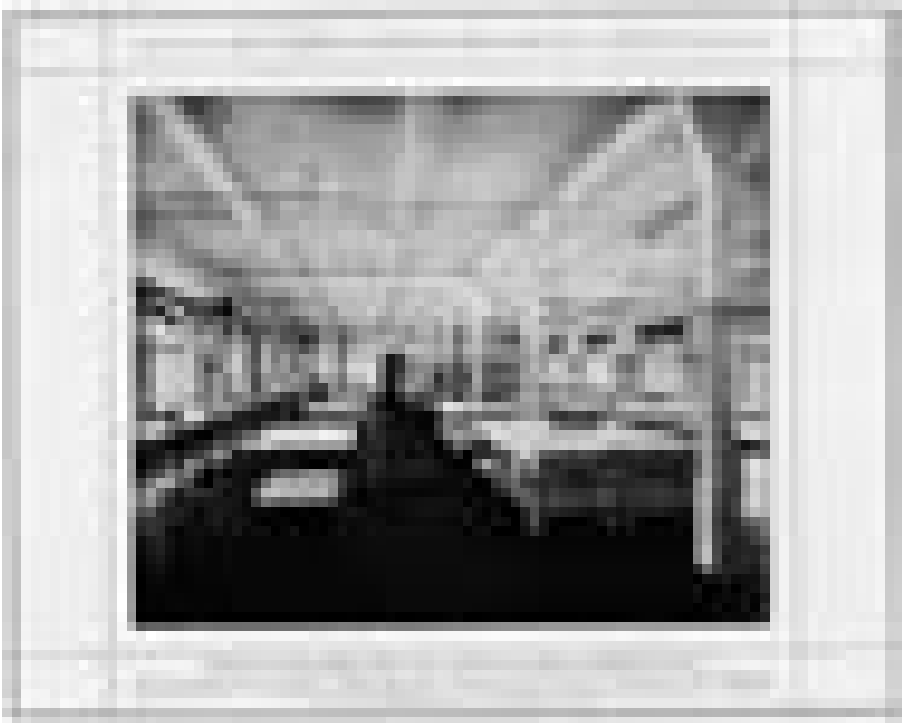
Abb. 8 Bekleidungsamt des XIX. Sächsischen Armeekorps in Leipzig-Möckern, Innenansicht 1900

Reichsgründung 1871, suchen, die in jedem dieser Teile eine gesonderte Zulassung erforderte. 35 Dies erübrigte sich erst mit dem Erscheinen der Preußischen Ministerialbestimmungen vom 16. April 1904 betr. die Ausführung und Berechnung von Konstruktionen aus Eisenbeton bei Hochbauten .