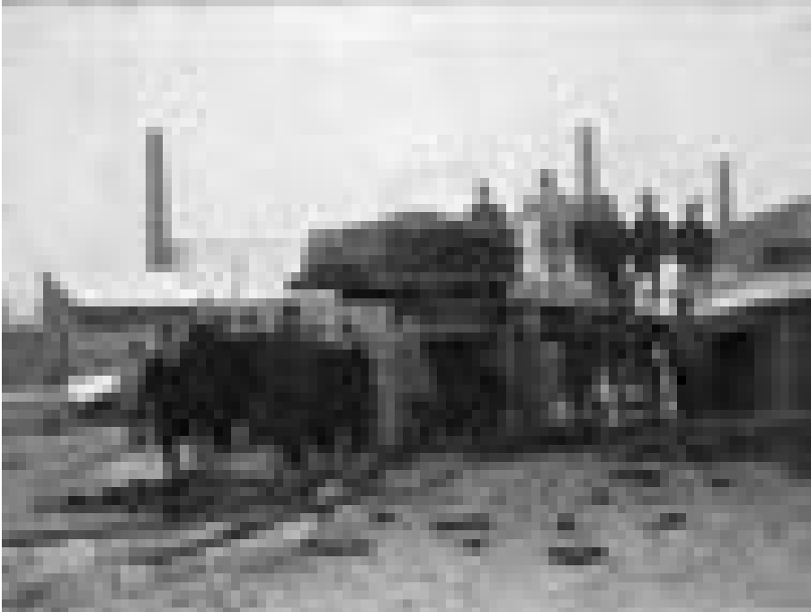
Abb. 3 Belastungsprobe auf dem Lagerplatz Riebeckstraße in Leipzig, 30./31. Januar 1899