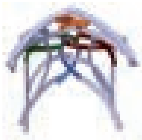
Abb. 2 Gewölbefiguration über der Reiterstiege, Hradschin Prag, um 1502. Dekonstruktion in der Bogenaustragung