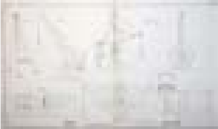
Abb. 2 Tafel 30 aus Band II der Istituzioni di architettura statica e idraulica von Cavalieri San-Bertolo ist direkt von den Tafeln 8, 9, 11 und 12 des Traité complet de mécanique: Mouvements des fardeaux von Giuseppe Antonio Borgnis (1818) übernommen.

de bâtir , 16 jedoch mit einer ungewohnt starken und für Italien umso überraschenderen Betonung des Holzbaus.