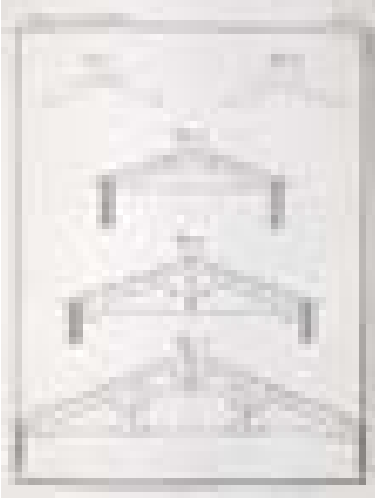
Abb. 4 Tafel 15 aus Band I der Istituzioni di architettura statica e idraulica von Cavalieri San- Bertolo zeigt italienische Pfettendachbinder, für die der Autor auch eine rechnerische Dimen- sionierungsmethode vorlegt.

weist ausdrücklich darauf hin, dass die Einhaltung der zulässigen Spannungen auch in den Anschlüssen und für lokale Pressungen nachgewiesen werden müsse: »In Holzkonstruktionen stützen sich gewisse Bauteile auf die Oberfläche anderer Bauteile oder sind dort eingezapft; somit übertragen sie nicht nur die Schnittgrößen des Systems, sondern üben auch lokale Pressungen aus, welche nach Überschreiten einer gewissen Grenze die Holzfasern beschädigen und eine bleibende Eindrückung sowohl im stützenden als auch in gestützten Bauteil hervorrufen. Solche Eindrückungen ändern die Form und die Abmessungen der Struktur und können kleine oder auch größere Änderungen des Beanspruchungszustands hervorrufen. Um diese Unannehmlichkeit zu vermeiden, muss man unbedingt darauf achten, das Holz keinen derart starken Pressungen zu unterwerfen, dass seine Härte überschritten wird.« 41 Dennoch werden bei der Nachrechnung der italienischen Binder alle statischen Nachweise nur für den Vollholzquerschnitt der Balken geführt. Abschließend kommt Cavalieri San-Bertolo zum Schluss, dass die üblichen Pfettendachbinder (Rofenabstand maximal 32 Zentimeter, Pfettenabstand weniger als 1,20 Meter, Binderabstand kleiner als 5,60 Meter) in der Regel standsicher seien, wenn auch nicht mit üppigen Reserven. Als Schwachstelle werden die Pfetten identifiziert: »Somit wäre es gefährlich, die Pfettenabstände zu erhöhen, ohne gleichzeitig die Binderabstände